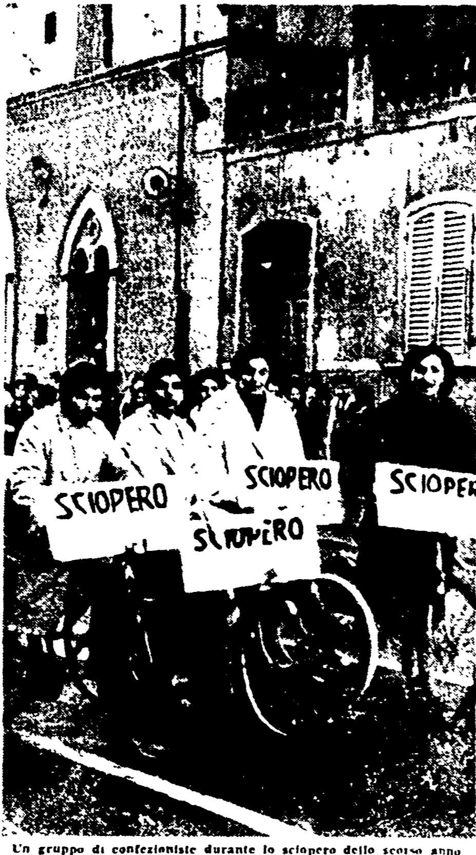
Un gruppo di confezioniste durante lo sciopero dello scorso anno

attendere alla stazione (molte vengono da Gambassi o da Montanone dove i contadini fuggono dalle campagne travestate da una paurosa crisi) con un pullman e le trasporta direttamente all'azienda. Questa apparente magnanimità dell'industriale nasconde però uno scoppo ben concreto, niente affatto sociale. Quelle ragazze affacciate ai finestrini dei pullman sono, come abbiamo già detto, giovanissime, sono «apprendiste». Inquadrata quindi in questa precategoria, le «apprendiste»